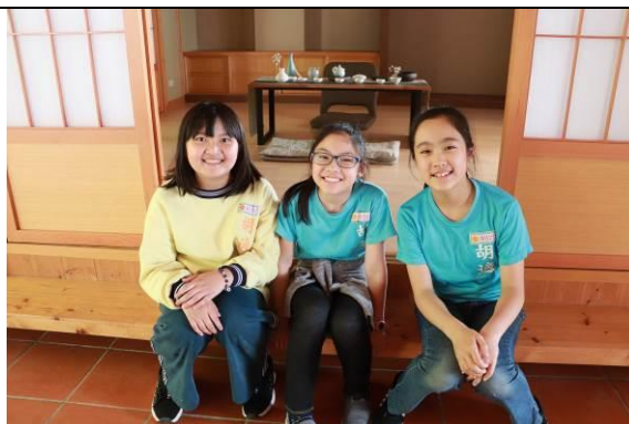
參觀茶葉示範場品茶情境室