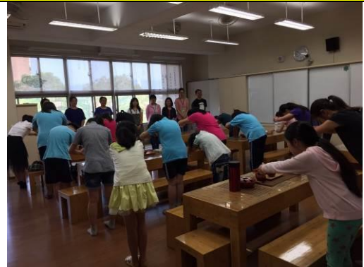
小茶師像大茶師行拜師禮