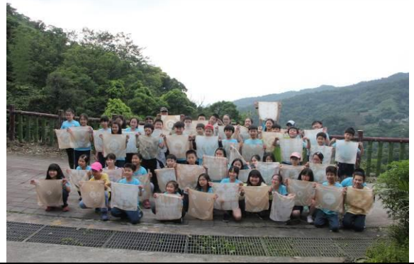
茶染 DIY 大成功與南港茶山合影