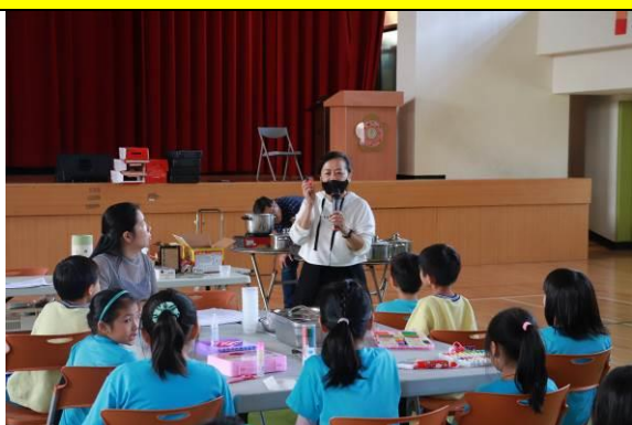
講師說明茶凍、茶泡飯製作方法