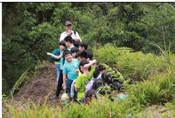
親近茶山自然的喜悅與自在