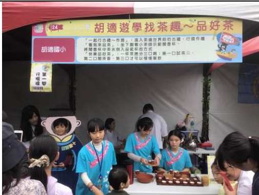
參加兒童月園遊會闖關活動擺攤