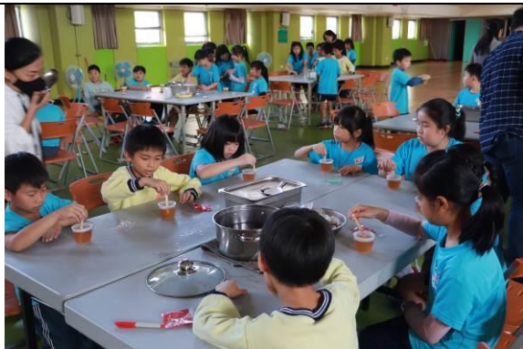
認真的攪拌讓茶凍均勻凝結