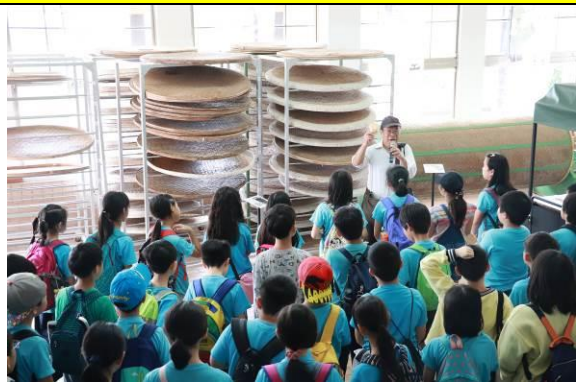
臺北茶葉示範場認識製茶器具