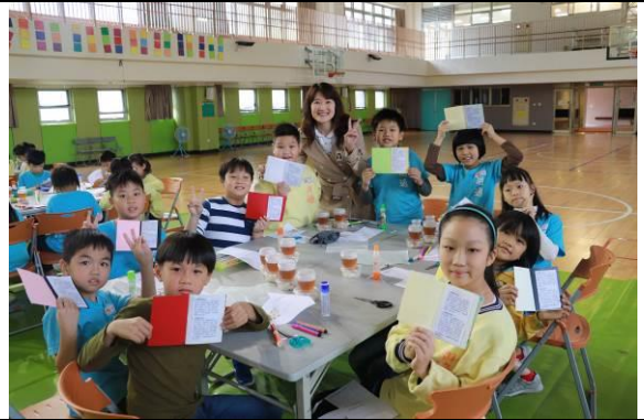
校長與同學開心的成果合影