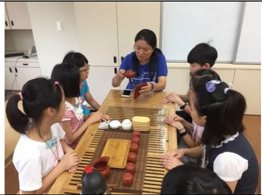
大茶師教導小茶師