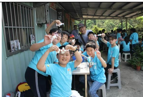
親自參與才能體會 DIY 喜悅樂趣