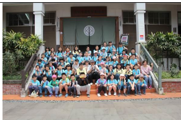
臺北茶葉示範中心合影