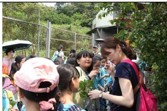
嚐試肉桂葉的味道