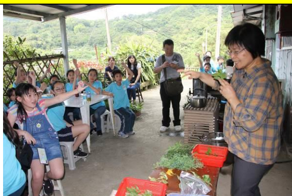
可染坊講師介紹香草植物