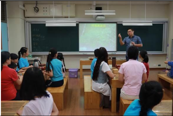
每雙週三定期集會的小茶師訓練