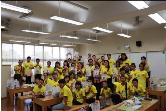
貴賓新美國小來訪交流品茶、做茶大合照