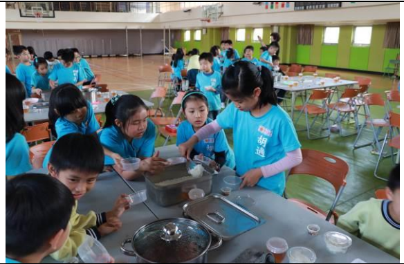
專注的體驗茶泡飯 DIY