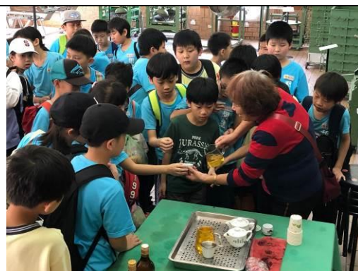
臺北茶葉示範中心品飲包種茶