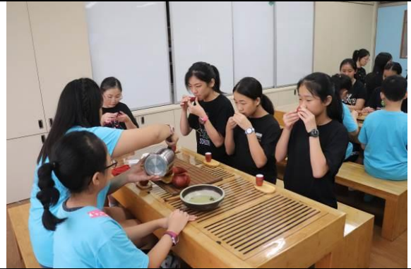
胡適畢業生品味在地剛收成的好茶