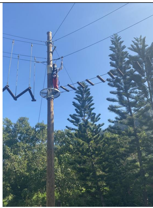
文字說明：高空探索、需要勇氣、更需要對自己相信！