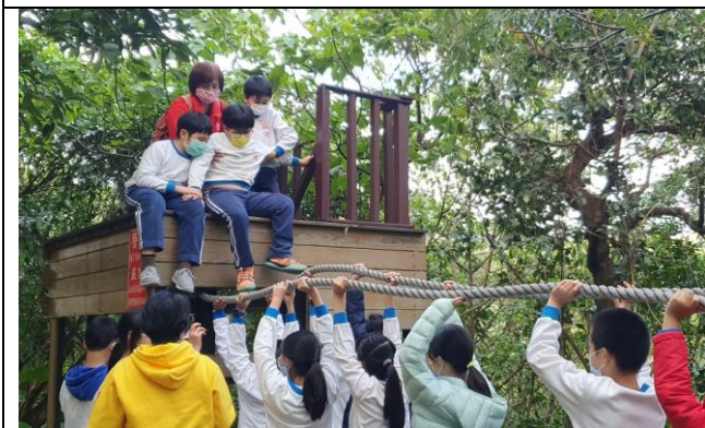
文字說明：挑戰過程中建立信任夥伴