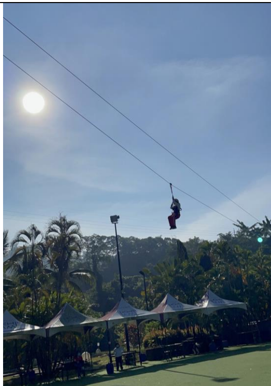
文字說明：挑戰自我，感受不同角度不同視野！