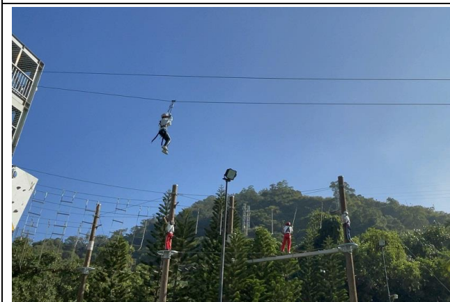
文字說明：高空探索、需要勇氣、更需要對自己相信！