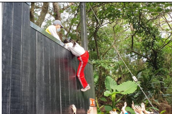
文字說明：挑戰成功，不一樣的感受！