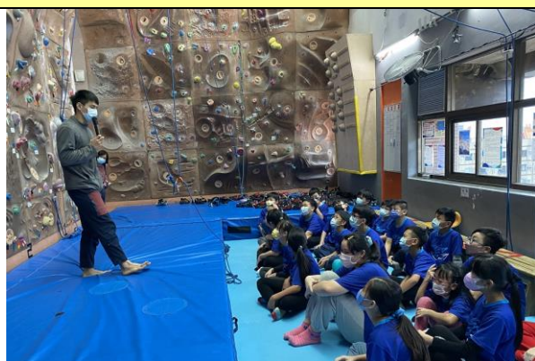
文字說明：學習攀岩技巧