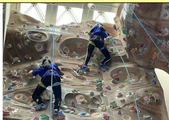
文字說明：室內攀岩初體驗