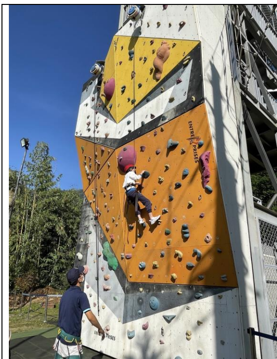
文字說明：習得技巧透過場域轉換進行發揮