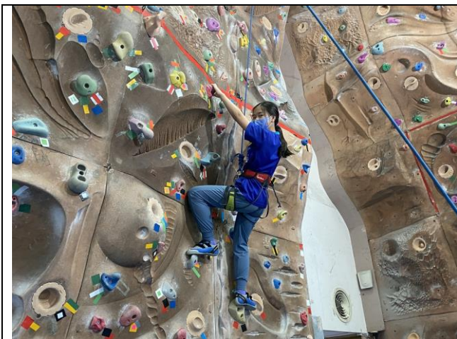
文字說明：挑戰自我