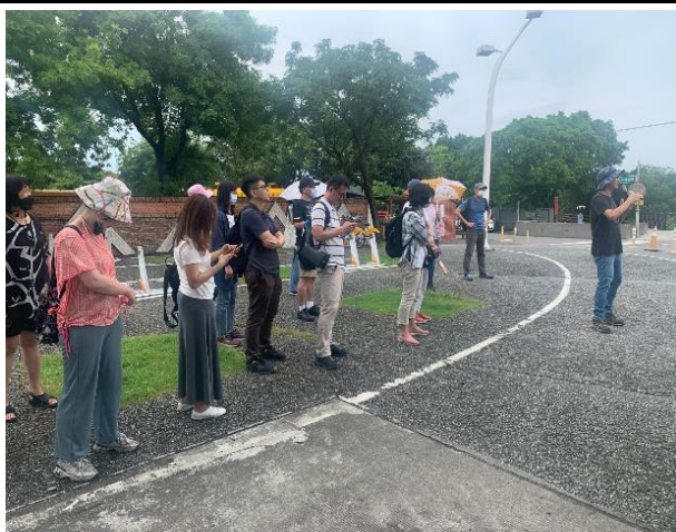
教師推廣研習_挖子尾生態解說