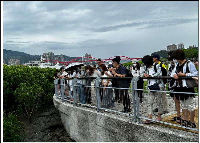
教師推廣研習_關渡碼頭生態解說