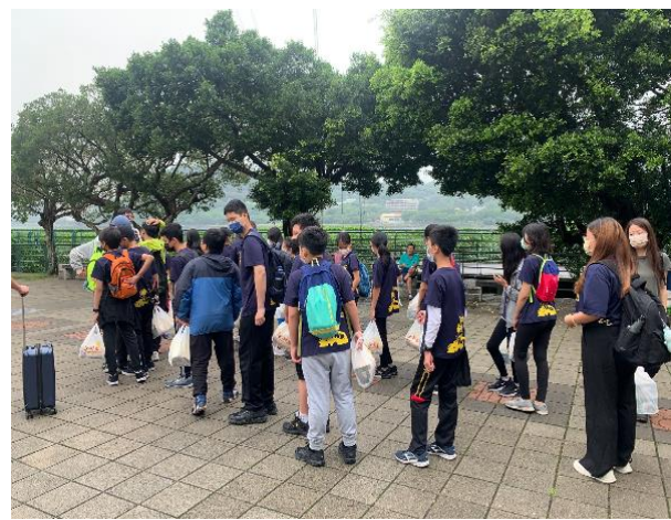
學生體驗學習路線