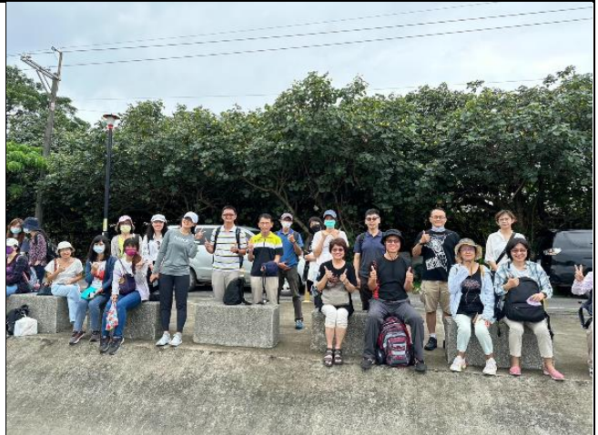
學習路線推廣教師研習