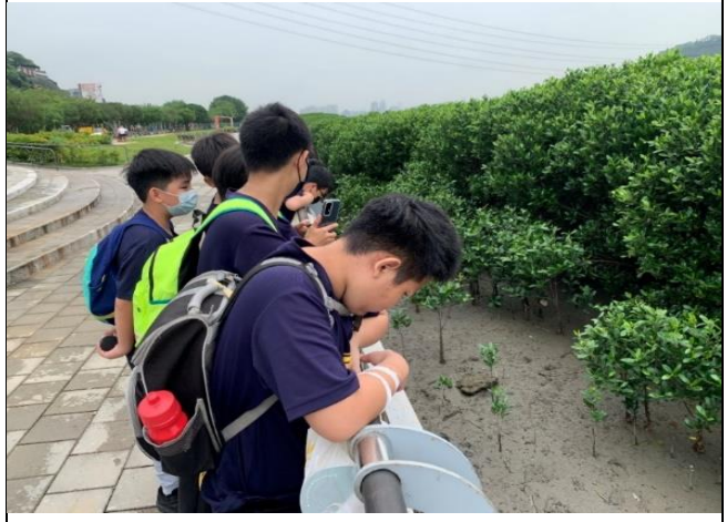
觀察招潮蟹、彈塗魚