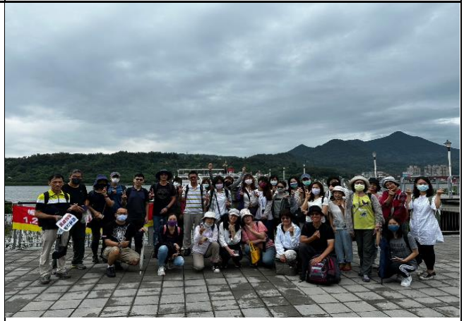
藍色水路增能研習