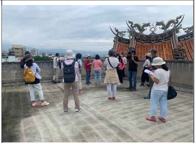
教師推廣研習_關渡宮