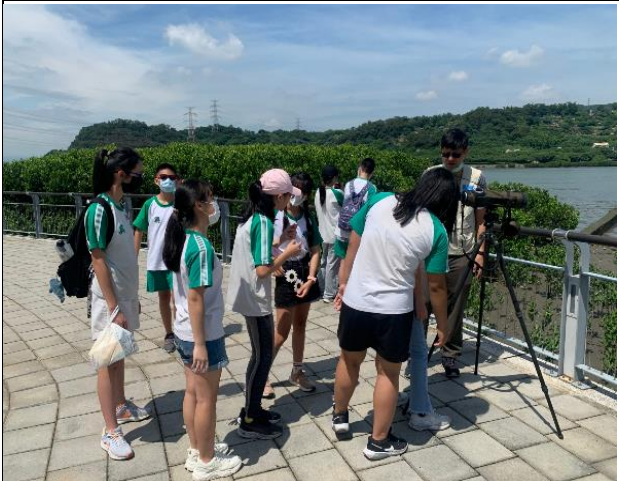
觀察淡水河濕地生態