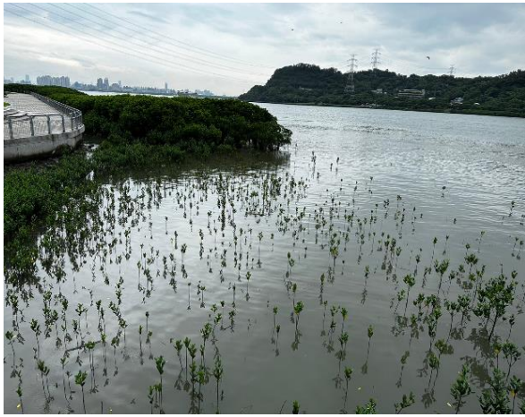
觀察淡水河濕地生態