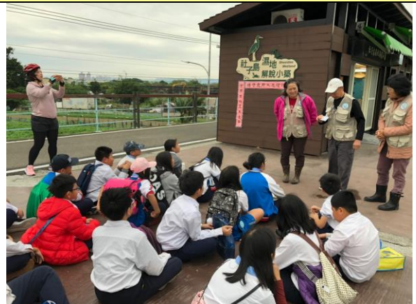
文字說明：認識解說小築