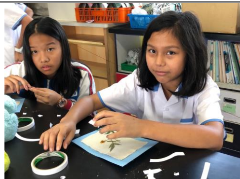
文字說明：手抄紙母親節卡片是蘆葦漿做的