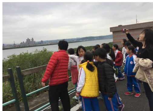
文字說明：小組為大家解說--高低堤防的來由及對社子島都市發展的影響