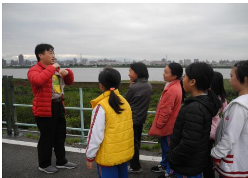
文字說明：沿途欣賞淡水河岸風光、觀察濕地生態與賞鳥。