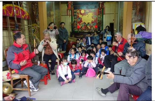
文字說明：進行實地探訪～前往坤天亭隔壁的南韻社，進行北管樂器的認識與學習，由社區耆老指導學生認識北管樂器，並吹奏樂曲。