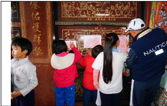
文字說明：進行廟宇牆壁石刻的淺浮雕拓印。