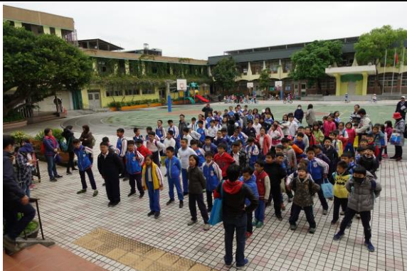
文字說明：我們準備要出發體驗農家樂。