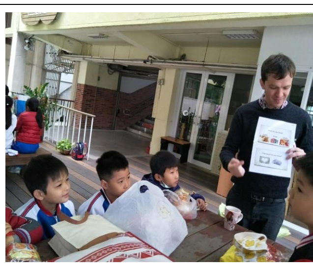
文字說明：回到學校闖關活動