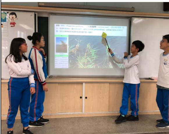
文字說明：主題分組報告