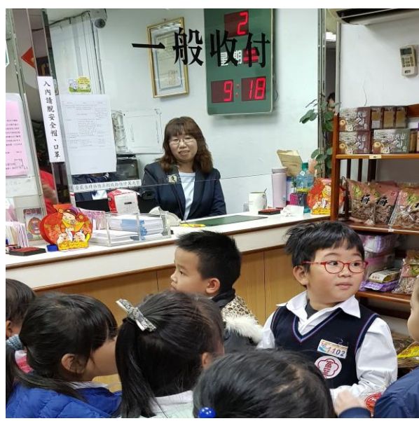
文字說明：農會內部參觀