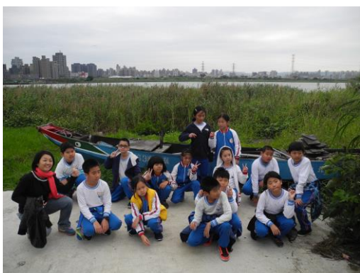
文字說明：步行至溪洲底渡船頭後，小