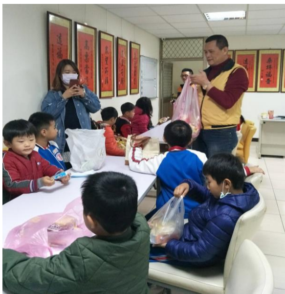
文字說明：參觀里辦公室