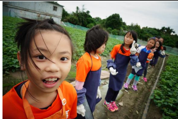
文字說明：腳踏社子土，近距離接觸。