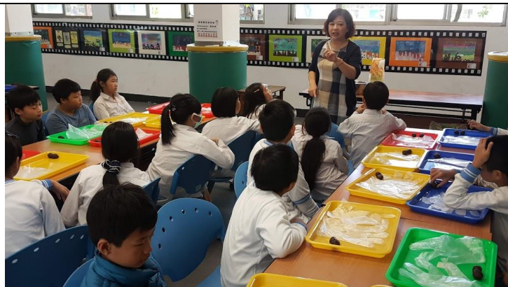
文字說明：結合社子島特有的植物，進行手抄紙活