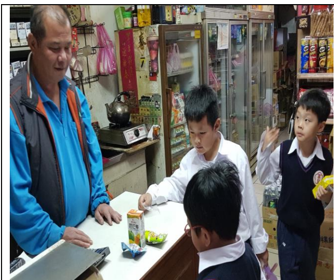
文字說明：店內實際用消費體驗