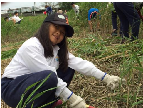
文字說明：河畔現場實做割蘆葦