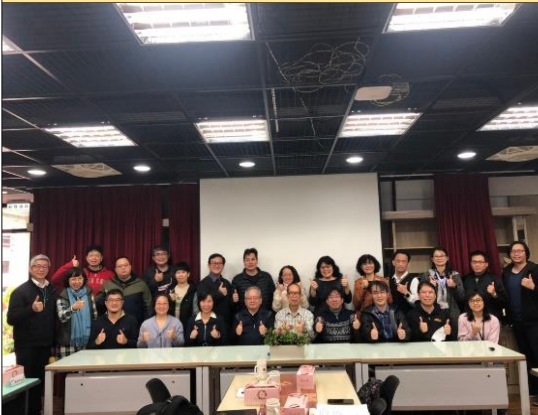
專家諮詢團隊和入校諮詢輔導團隊