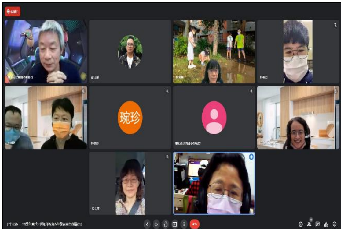
四年發展計畫 2nd 會議