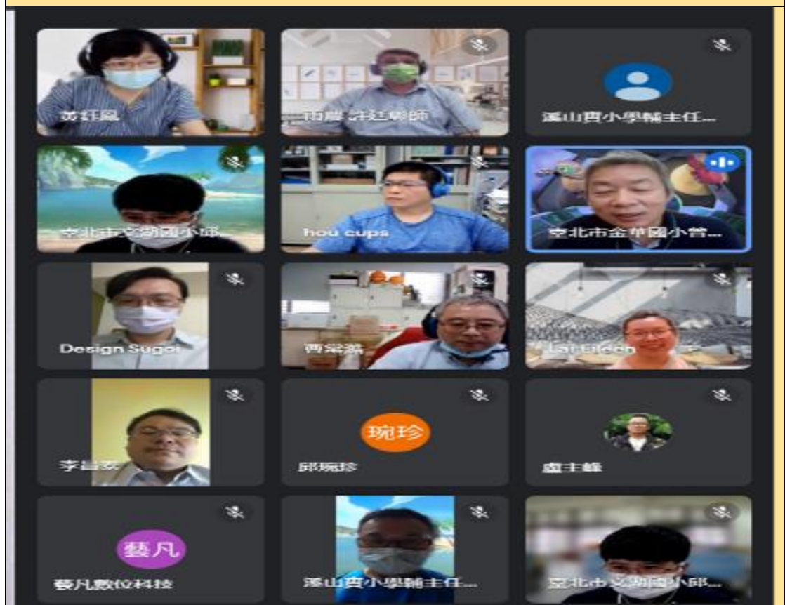
網站架構驗收會議