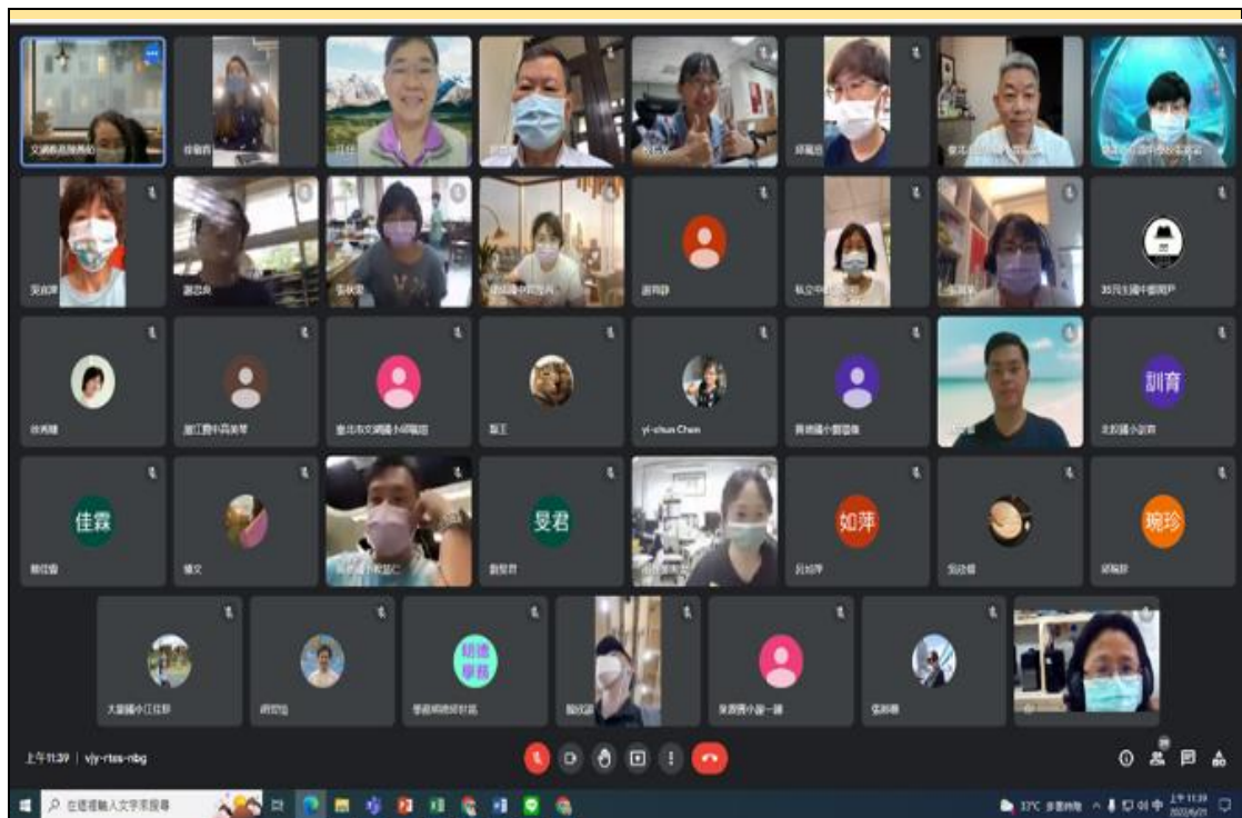
線上諮詢輔導會議