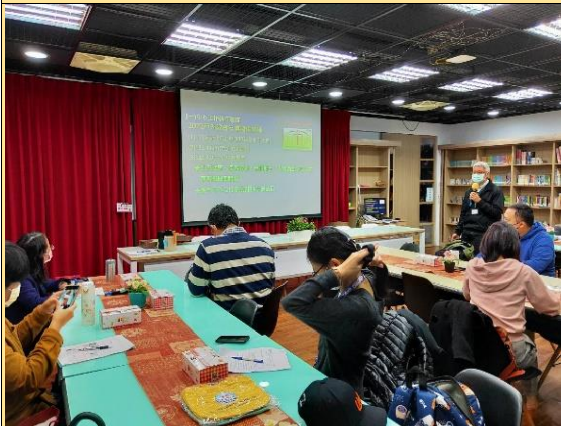
戶外教育年會籌備會議