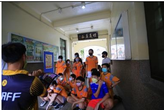
05. 社區定向運動，教練說明地圖使用方式