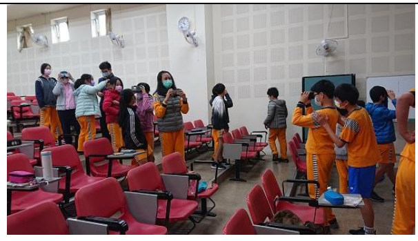
04. 學生練習操作 AR 設備