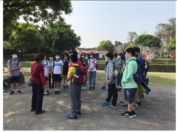
02. 林安泰古厝導覽，學生蒐集資料