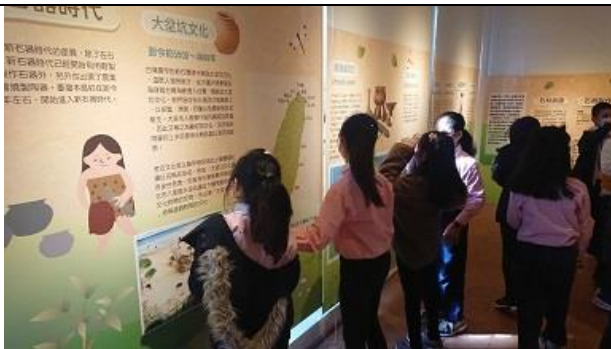
03. 大龍國小訊塘埔文物室， 小導覽員分組發表。