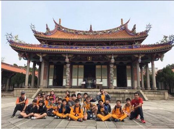
01. 臺北孔廟導覽，學生蒐集資料