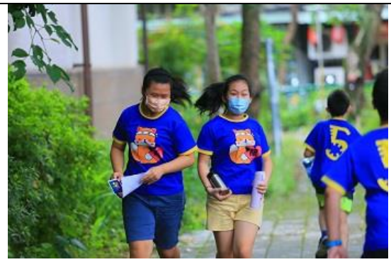
06. 社區定向運動，學生兩人一組， 完成各項地圖上的任務