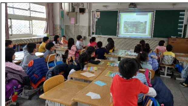
文字說明：教師透過簡報於行前進行說明探訪重點及注意事項