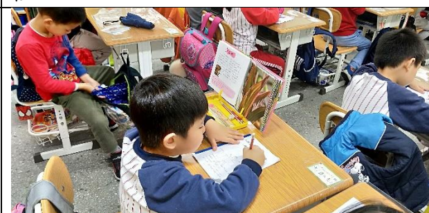
文字說明：返校後繼續完成學習手冊的內容