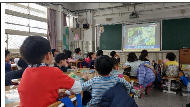
文字說明：使用影片介紹『魚梯』功能與生態環境之重要性