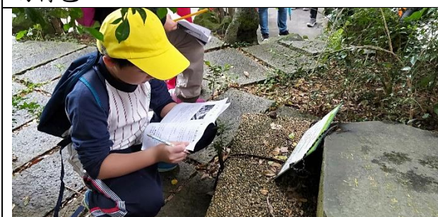
文字說明：透過植物解說牌，認識小坑溪沿途的生態