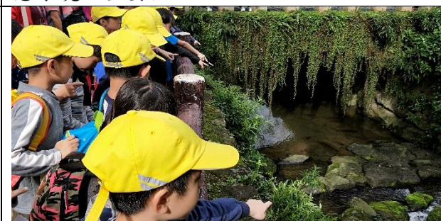
文字說明：觀察魚梯，想想看為什麼要有這樣的設計？