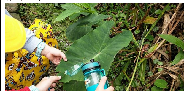
文字說明：透過實際操作認識植物的葉子特性