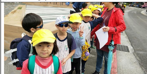
文字說明：排好隊，準備出發！