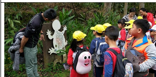
文字說明：透過景點解說牌，認識小坑溪沿途的特色