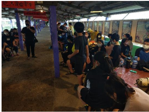
文字說明：農場介紹及有獎徵答