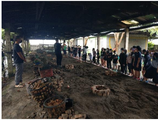
文字說明：煙窯解說