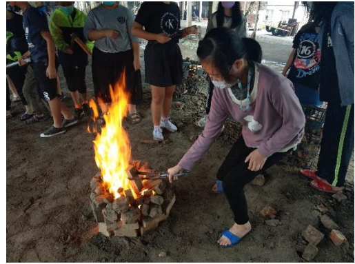
文字說明：每位學生都操作添加柴火