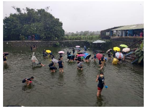
文字說明：湧泉生態鏈-摸蜆體驗