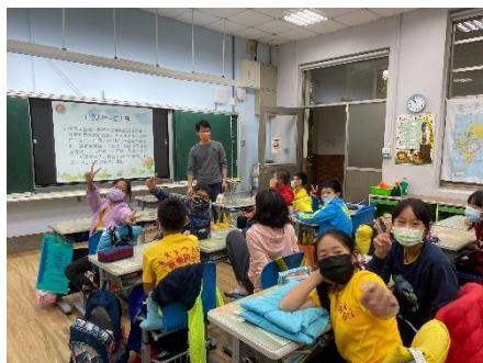
文字說明：校外教學的行前課程