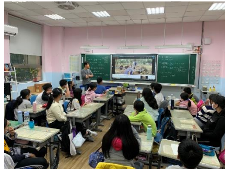
文字說明：場域做安全解說