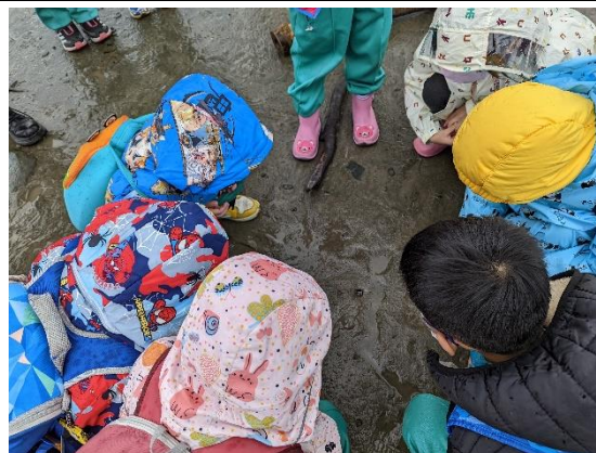
照片說明：踏查社六溼地(一年級)