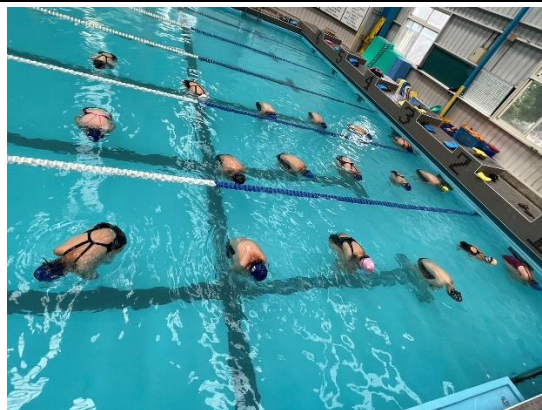
照片說明：水母漂(六年級)