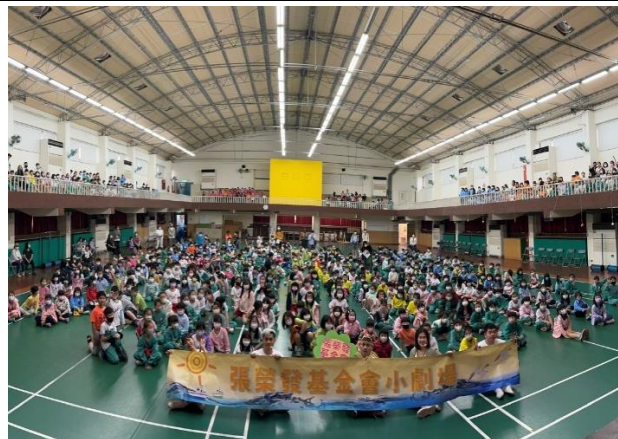
照片說明：海洋教育宣導劇 (幼兒園、一至三年級)