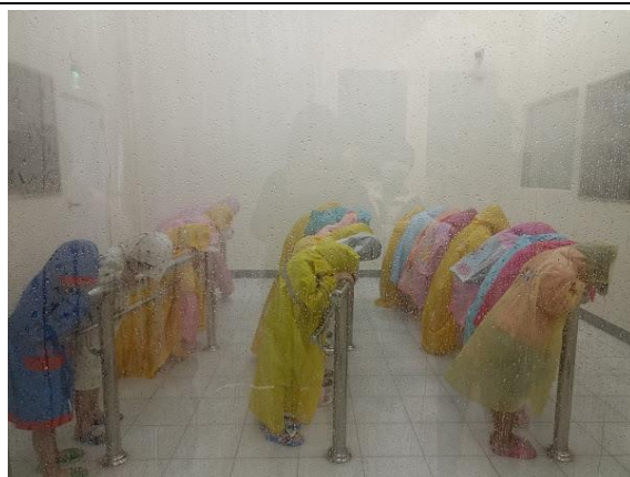
照片說明：新生建國抽水站參訪(一年級)