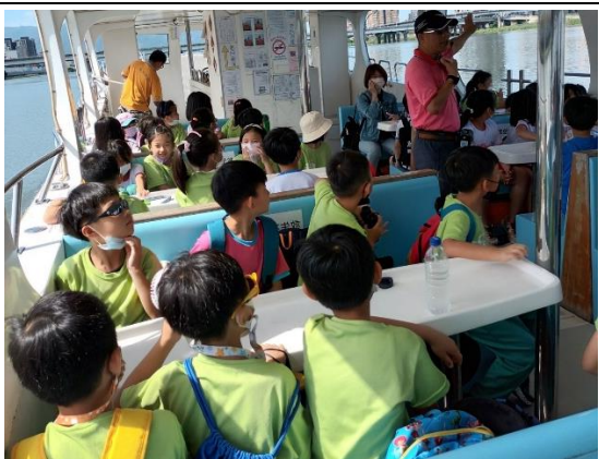
照片說明：藍色水路體驗(二年級)