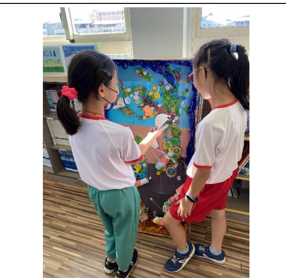
照片說明：創作作品結合藝文領域課程