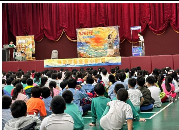
照片說明：海洋教育宣導劇 (幼兒園、一至三年級)

海洋生態保護小劇場：透過戲劇演出，瞭解人類不當的行為對河流及海洋生態的危害，培養關懷生物、尊重生命、珍惜自然的態度。