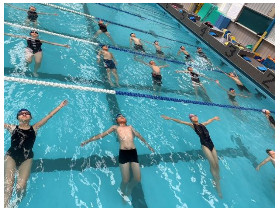
照片說明：仰漂(六年級)