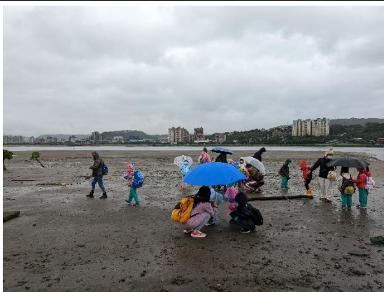
照片說明：踏查社六溼地(一年級)