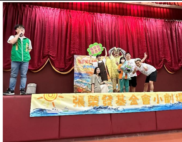
照片說明：有獎徵答時間