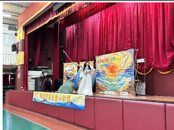
照片說明：海洋教育宣導劇 (幼兒園、一至三年級)