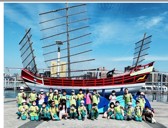
照片說明：藍色水路體驗(二年級)