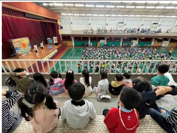
照片說明：海洋教育宣導劇 (幼兒園、一至三年級)