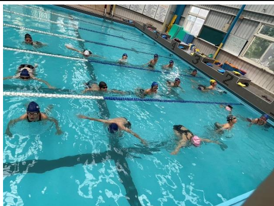
照片說明：抽筋自救(五年級)