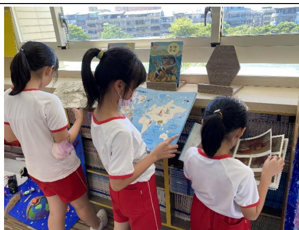
照片說明：閱讀海洋教育類別書籍