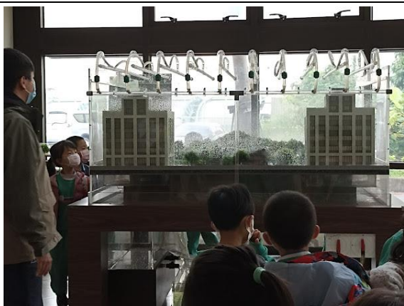
照片說明：新生建國抽水站參訪(一年級)