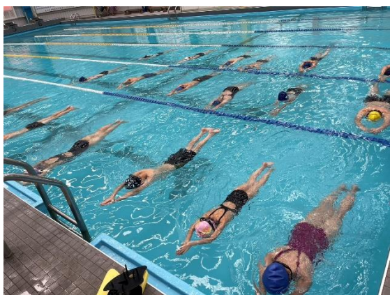
照片說明：漂浮(六年級)