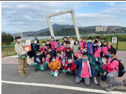
照片說明：踏查島頭公園(四年級)