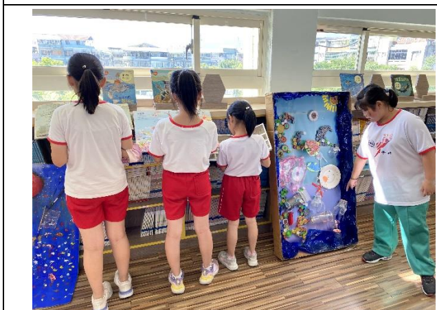
照片說明：欣賞學生創作作品