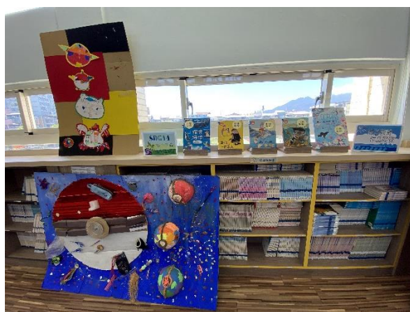
照片說明：廢棄物創作特展