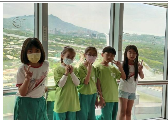
照片說明：北投焚化爐參訪(二年級)