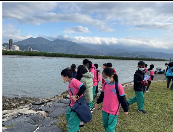
照片說明：踏查島頭公園(四年級)