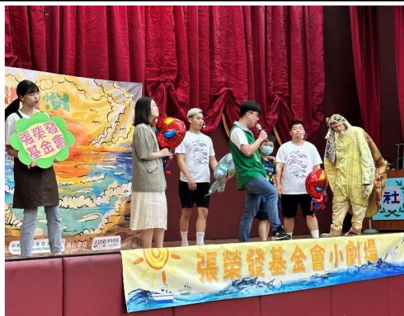
照片說明：有獎徵答時間