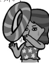
④ 拋 拋送救生圈、球、繩等漂浮物