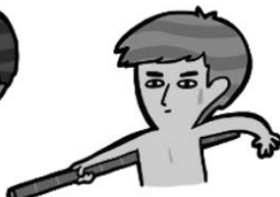
③ 伸 伸出竹竿、樹枝等延伸物