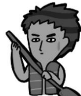
⑤ 划 利用大型浮具划過去(船、救生圈、浮木、救生浮標等)