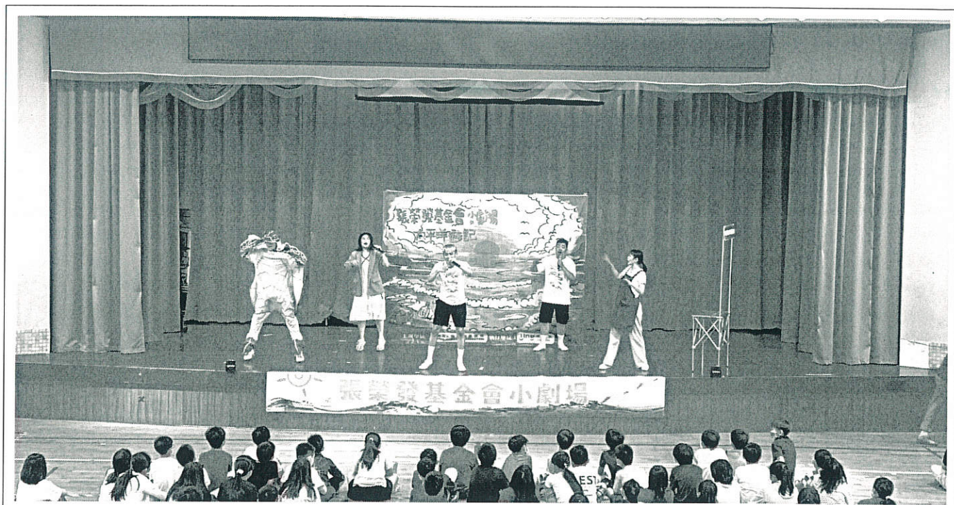
海洋永續小劇場演出實況