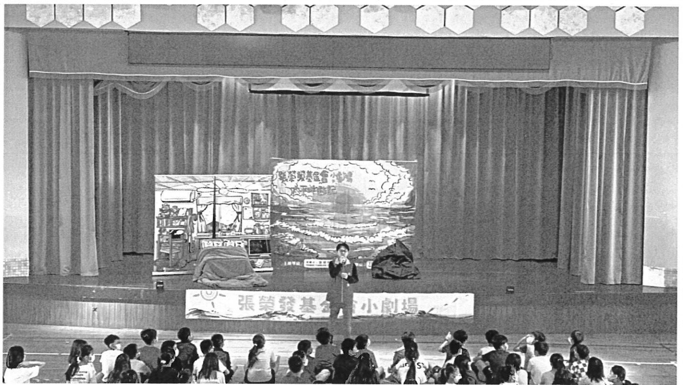
張榮發基金會與靖學工作室合辦海洋永續小劇場