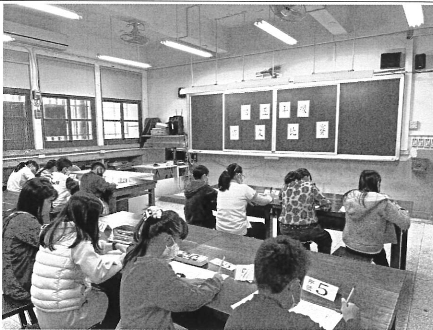
學生於寫作文的過程中，學習愛護海洋