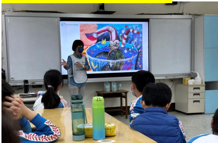
環境繪畫比賽作品導覽