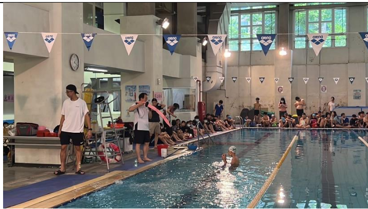
溺水自救他救方式 2