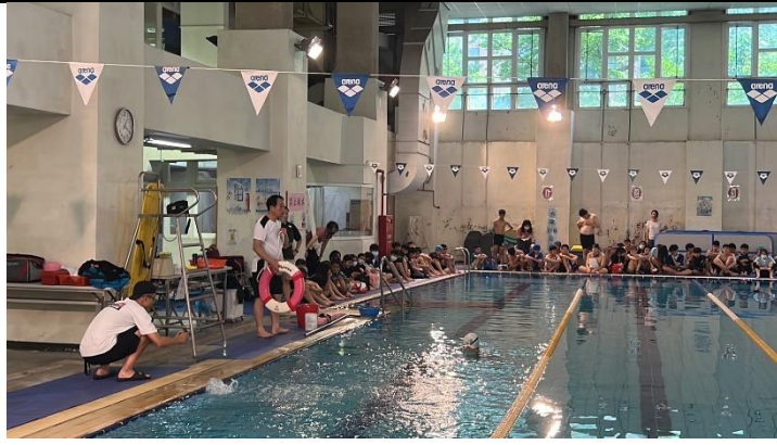
溺水自救他救方式 1