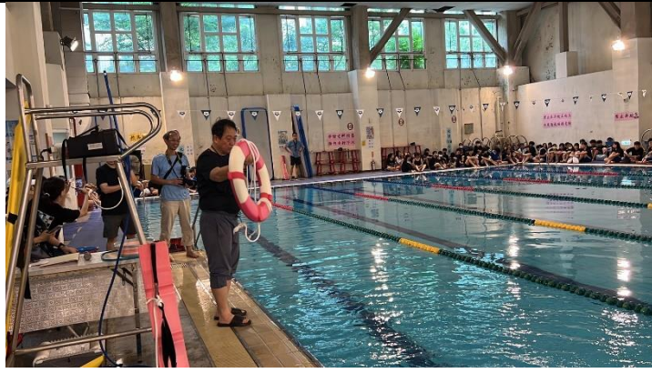
溺水自救他救方式 1