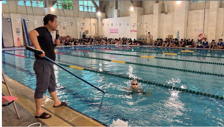
溺水自救他救方式 2